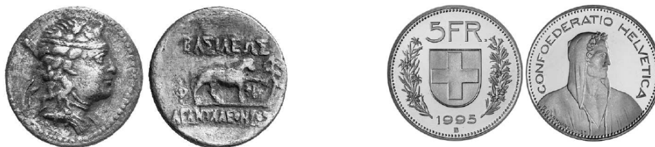
Figure 1 Pièces de monnaie (grecque antique et suisse moderne) en cupronickel (75% Cu, 25% Ni)

Les alliages de cuivre Cu et de nickel Ni (cupronickels), très résistants à la corrosion, ont été utilisés depuis très longtemps, notamment pour la production de pièces de monnaie (voir figure 1), mais aussi pour des applications en construction navale. Cet alliage présente la particularité d'une miscibilité complète des deux métaux l'un dans l'autre, à l'état liquide mais aussi à l'état solide (les deux métaux cristallisent dans le même système cubique à faces centrées, et présentent des rayons atomiques voisins).