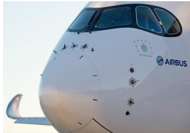
Tubes de Pitot sur le nez d'un A350 (notez le winglet sur le bout d'aile)