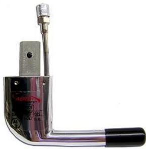
Tube de Pitot pour avion (~2500 €)