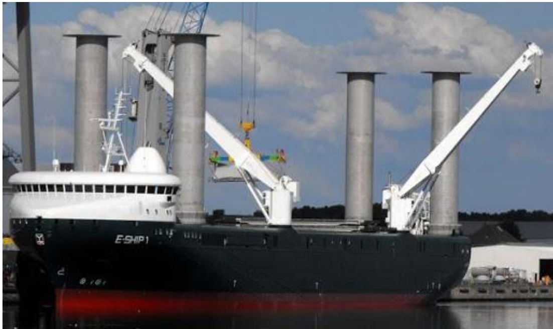
E-Ship 1 - 2010